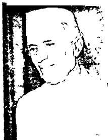
Bharata Ratna Nehru